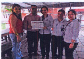
LICENCIAS DE CONDUCCIÓN